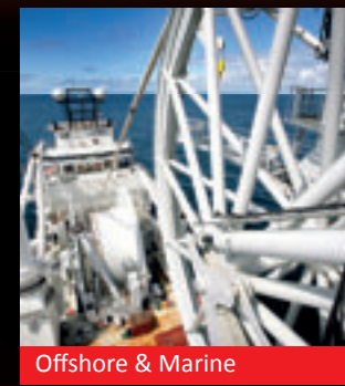
Offshore & Marine